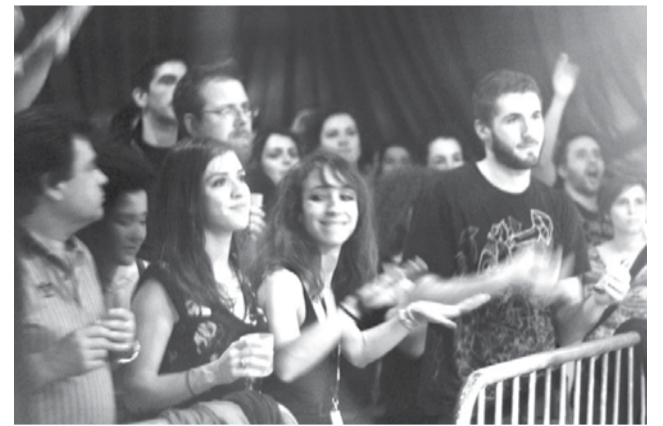
Fiesta Cinélatino 2015

🕒 12/03 · 16h15 🕒 15/03 · 14h25 🕒 17/03 · 17h40