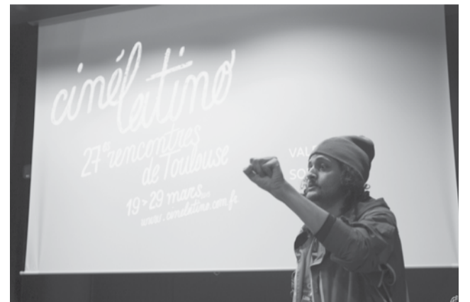
Carte blanche Sens Dessus Dessous : l'accessibilité aux sourds et malentendants