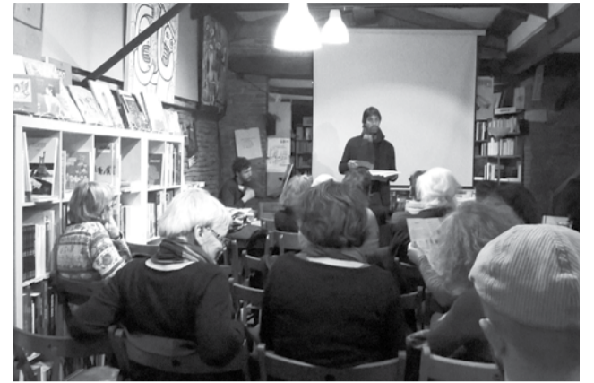
Présentation Sélection Documentaire - 2016