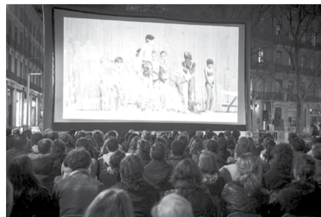
Ouverture 2015 : courts-métrages