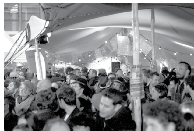
Barrio 2015 : cour de la Cinémathèque