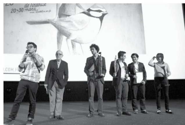
Remise des prix 2014