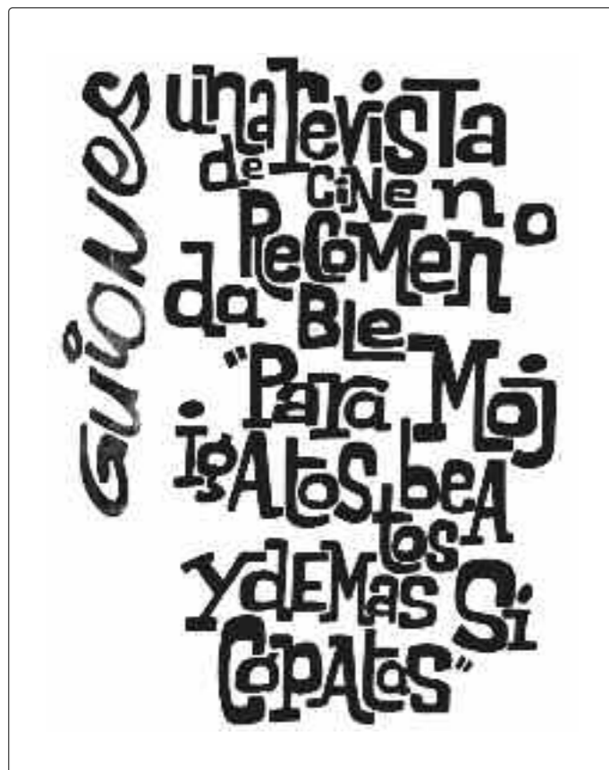
Anuncio promocional de Guiones, hacia 1980

de grandes maestros cuando consideraba que su cine respondía a una expresión censurada, y un buen ejemplo de ello está en su texto sobre La ventana indiscreta (1954) de Hitchcock.