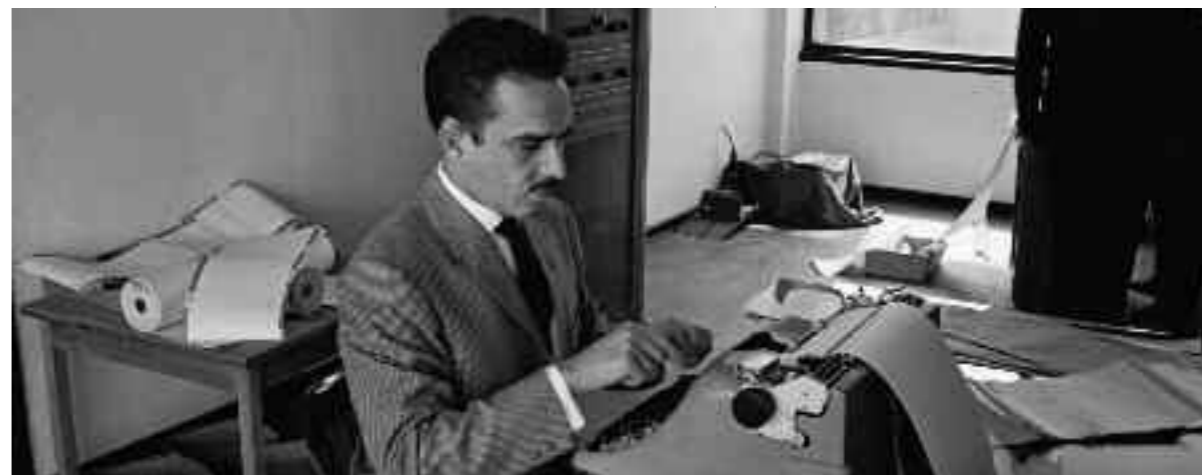
Gabriel García Márquez, periodista en Prensa Latina , 1958

La passion de García Márquez pour le cinéma est bien connue: tout en menant une activité journalistique, il rédigea des critiques de films, puis il écrivit des scénarios à Mexico et, lorsqu'il devint célèbre, il créa de nouveaux scénarios et continua à travailler dans le cinéma. Il créa la Fondation du Nouveau Cinéma Latinoaméricain ( Fundación del Nuevo Cine Latinoamericano ) et l'École Internationale de Cinéma et de Télévision de San Antonio de los Baños ( Escuela Internacional de Cine y Televisión de San Antonio de los Baños , EICTV). Gabo donna des cours de rédaction scénaristique à la EICTV et fut à l'origine de la réalisation d'une centaine de films sur le continent. La contribution de García Márquez au cinéma est importante, même si ses propres scénarios étaient problématiques (des dialogues solennels et artificiels, des adjectivations constantes), et que ses apports en tant que critique de cinéma soient discutables. Le Gabo critique de cinéma est assez contradictoire: d'une part, il fait preuve d'une connaissance limitée de l'histoire du cinéma et ses réflexions sur les films se fondent assez peu sur des valeurs propres au septième art. D'autre part, il y a dans ses textes des moments de bravoure où perce la grandeur du critique, quand se rejoignent brillamment sa sensibilité sociale et sa sensibilité cinématographique. Son texte sur