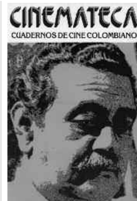
Cuadernos de cine colombiano, 1977

También en los años 1970, pero en Cali, se mostró otra opción: los cineastas caleños veían el cine como una herramienta de transformación social, sí, pero también como arte, espectáculo y entretenimiento. En un documental, Luis Ospina dijo: "Nos cansamos de hacer crítica escrita y decidimos hacer crítica de cine con el cine". Ospina se refería al filme Agarrando pueblo (1978), la obra experimental que dirigió con Carlos Mayolo, una cinta donde se critica a quienes hicieron un cine industrial que explotaba la miseria, pero también a los que usaron la miseria y el cine como herramientas en detrimento de valores estéticos y de un verdadero cambio social. Entre 1974 y 1977, el Grupo de Cali publicó cinco números de la revista Ojo al cine de la que Andrés Caicedo (1951-1977) fue director. Caicedo fue un escritor que se suicidó tras publicar su primera novela, pero además fue crítico de cine, cine-clubista, guionista, actor y realizador. Los textos de Caicedo mostraban su cinefilia, pero a la vez la clara intención de azuzar al público. En su conferencia Especificidad del cine , dice: "Lo que comenzó siendo la distracción ideal para los analfabetos, es hoy el arte de los analfabetos". Lo que Caicedo y todo el Grupo de Cali se proponía con Ojo al cine era una crítica que despertara al espectador