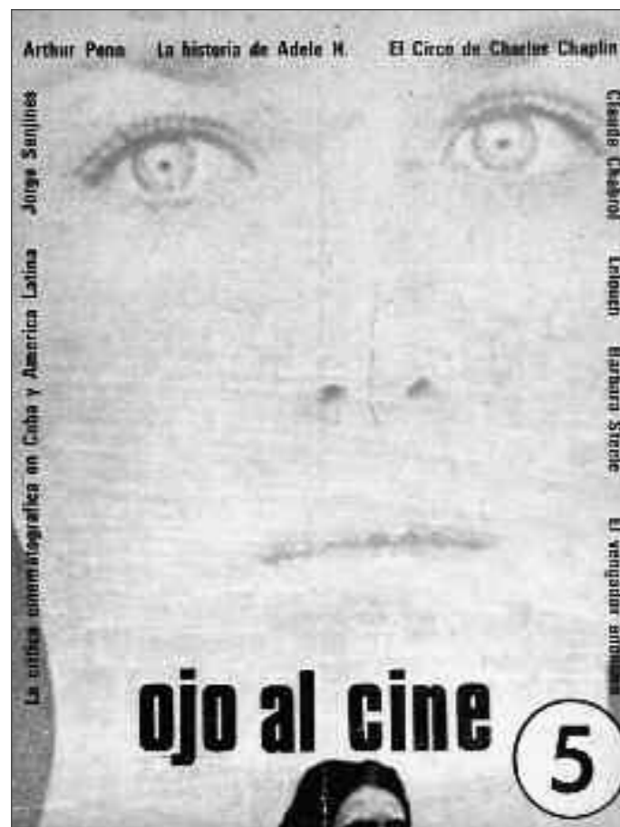
Ojo al cine, 1976

para que pudiera defenderse el Grupo de Cali estaba formado por cinéfilos con un amplio conocimiento de la historia del cine y para ellos el cine también era arte y espectáculo.