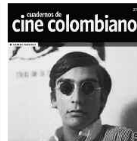
Cuadernos de cine colombiano - Nueva época, 2015