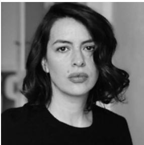
KLAUDIA REYNICKE Réalisatrice de REINAS