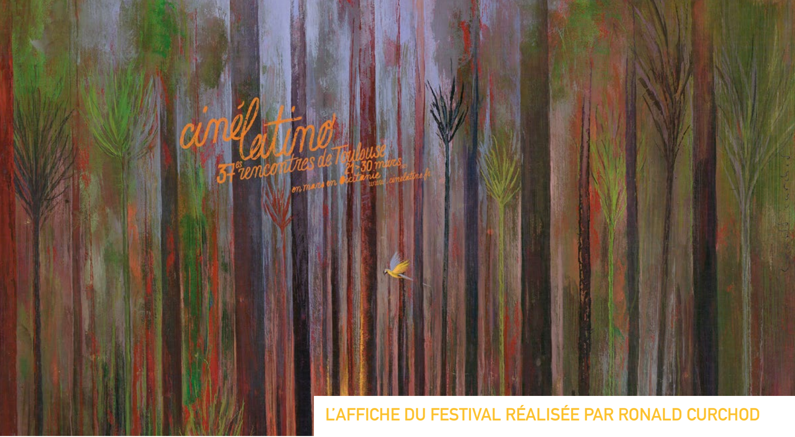
L'AFFICHE DU FESTIVAL RÉALISÉE PAR RONALD CURCHOD